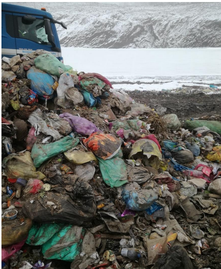
Foto odpadu dovezeného z Kopidlna na skládku Košťálov 14.12.2023

Zbytkový směsný komunální odpad má obsahovat jen nerecyklovatelné odpady či jinak nevyužitelný zbytek komunálních odpadů. Zbytkový směsný komunální stále odpad obsahuje kolem 70 % recyklovatelných složek.